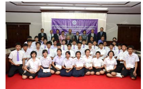
พิธีมอบเงินช่วยเหลือพิเศษ ของคณะกรรมการส่งเสริมมหาวิทยาลัยเชียงใหม่

เพื่อให้นักเรียนดังกล่าวได้มีโอกาสเข้าศึกษาต่อในมหาวิทยาลัยเชียงใหม่และเป็นการพัฒนาคุณภาพของเยาวชนของชาติในภาคเหนือโดยส่วนรวม คณะกรรมการส่งเสริมมหาวิทยาลัยเชียงใหม่ จึงระดมเงินจากผู้มีจิตกุศล และมอบเป็นเงินช่วยเหลือพิเศษให้แก่นักเรียนที่มีคุณสมบัติดังกล่าว รายละเอียด 6,000.-บาท (หกพันบาทถ้วน) เพื่อใช้จ่ายเป็นค่าเดินทางไปรายงานตัวเป็นนักศึกษา ค่าเครื่องแต่งกาย และค่าขึ้นทะเบียนเป็นนักศึกษา ในภาคการศึกษาที่ 1 ประจำปีการศึกษา 2556