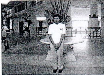
ザ・テラスホテルズ(株)