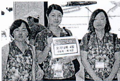
沖縄ツーリスト(株)