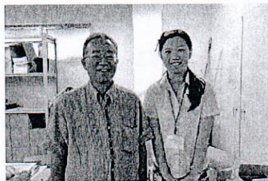
トヨタレンタリース沖縄(株)