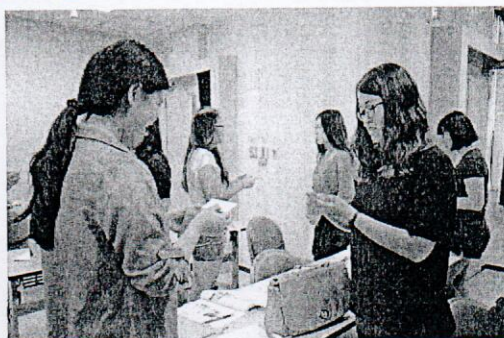
ビジネス日本語研修