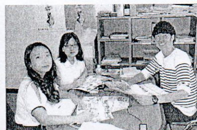
(有) サザンクロスロード