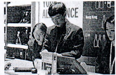
(株) DFS 沖縄