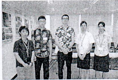
沖縄観光コンベンションビューロー