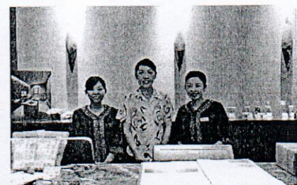
(株) パシフィックホスピタリティグループ