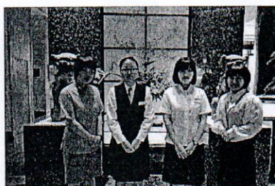
ANA クラウンプラザ沖縄ハーバービュー