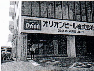
(株) オリオンビール