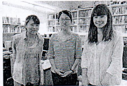
(有) スタプランニング