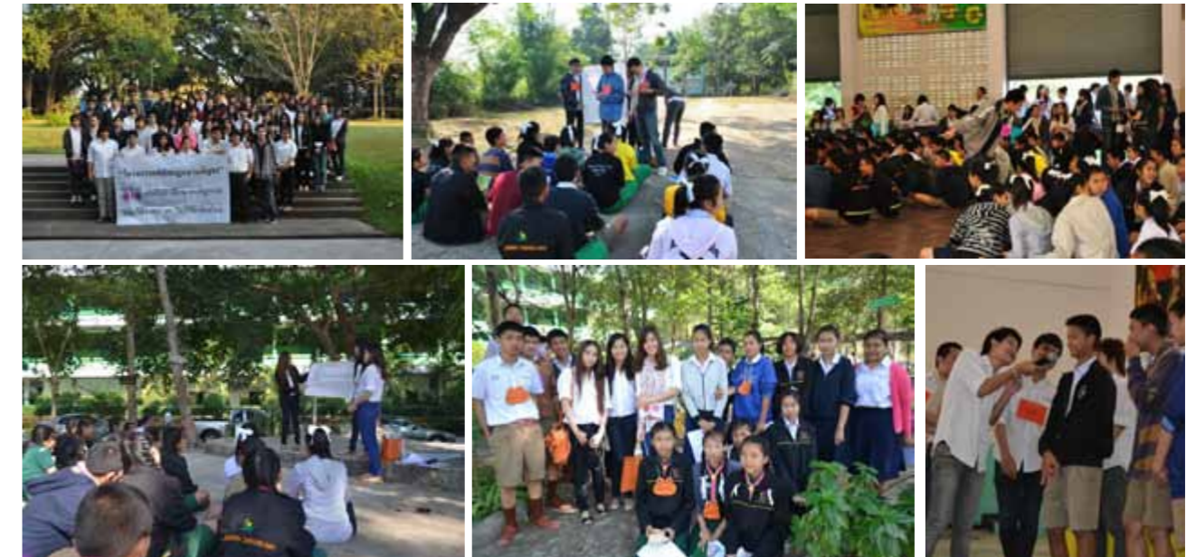
โครงการคลินิกสัญจรครั้งที่ 2/2554 การเผยแพร่ความรู้ทางกฎหมายเรื่องความรุนแรงในครอบครัวให้แก่นักเรียนระดับมัธยมศึกษา