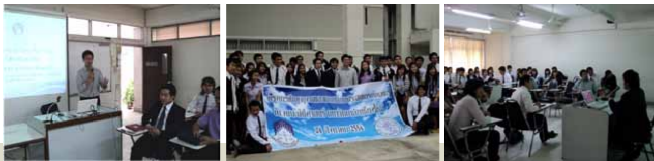
ต้อนรับคณะคณาจารย์และสโมสรนิสิตคณะนิติศาสตร์ มหาวิทยาลัยพะเยาซึ่งขอเข้าศึกษาดูงาน ด้านกิจการนักศึกษา และศูนย์ให้คำปรึกษาทางกฎหมาย