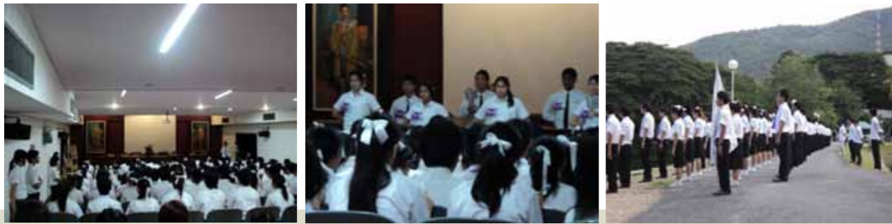
กิจกรรมสอนน้องร้องเพลงเชียร์ ประจำปีการศึกษา 2554