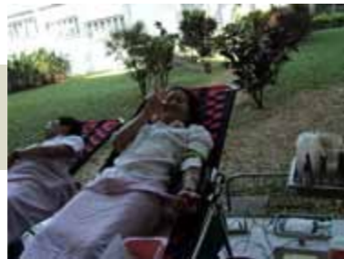
ร่วมกับสำนักงานเหล่ากาชาดจังหวัดเชียงใหม่ จัดกิจกรรมบริจาคโลหิต