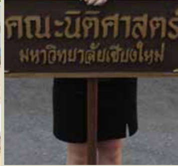
กิจกรรมวันสปอร์ตเดย์ มหาวิทยาลัยเชียงใหม่