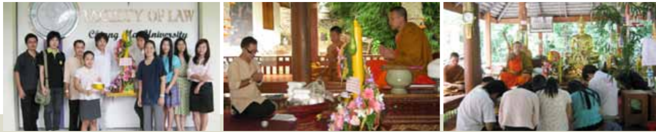
โครงการกิจกรรมถวายเทียนพรรษา