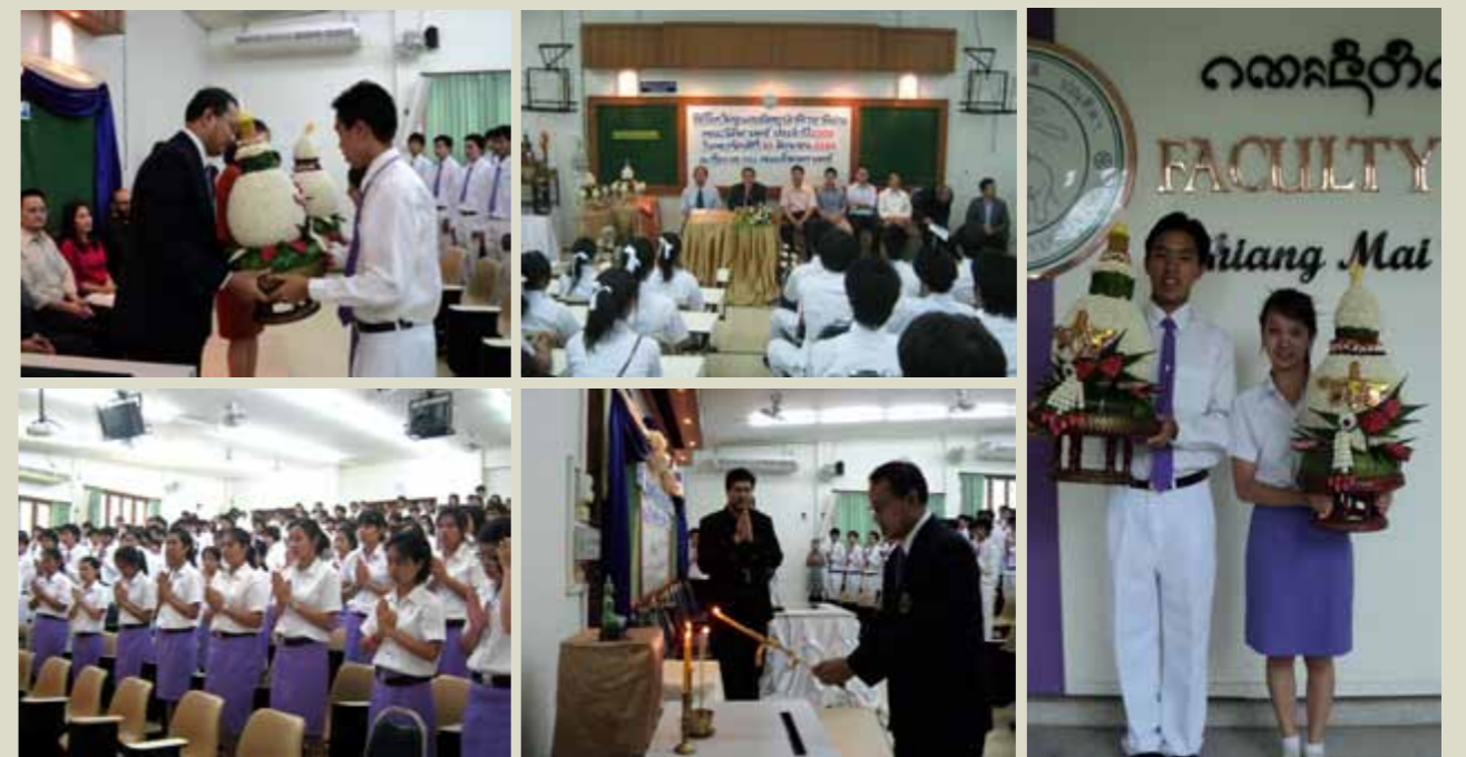
พิธีไหว้ครูและเชิดชูนักศึกษาดีเด่น