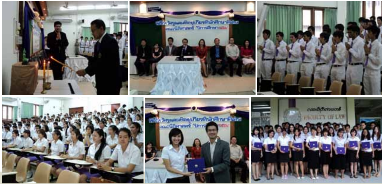
โครงการพิธีไหว้ครูและเชิดชูนักศึกษาดีเด่นคณะนิติศาสตร์