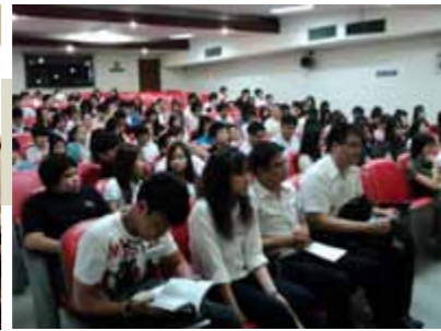
กิจกรรมแนะน่าน้องฝึกงาน