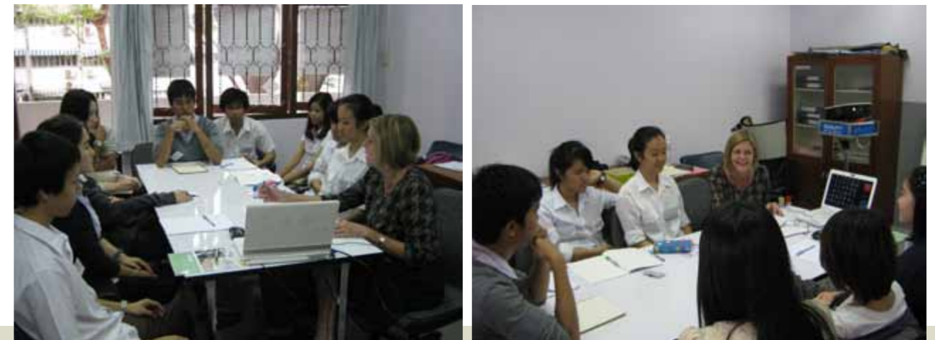
โครงการ พัฒนาศักยภาพนักศึกษาคณะนิติศาสตร์ ภาษาอังกฤษเพื่อนักกฎหมาย (English Skill Training for Lawyer Programme)