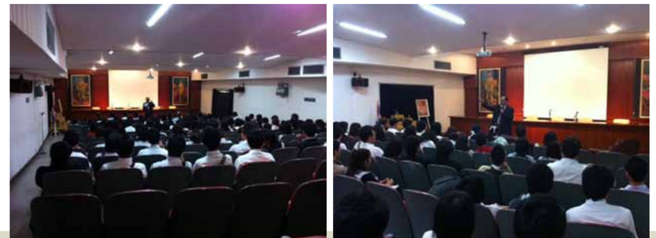
โครงการ บรรยายพิเศษ เรื่อง “การพัฒนาศักยภาพของนักศึกษานิติศาสตร์” โดยคุณวิวัฒน์ เศรษฐช่วย