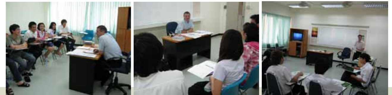
โครงการฝึกทักษะภาษาอังกฤษและประชาคมอาเซียน (หลักสูตรภาษาอังกฤษคุณภาพต่อเนื่อง ณ สถาบันภาษา มหาวิทยาลัยเชียงใหม่)