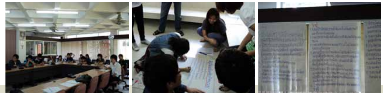
กิจกรรมสัมมนาสโมสรนักศึกษาคณะนิติศาสตร์ และสร้างนักกิจกรรมรุ่นใหม่