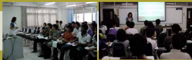
บรรยายการให้ความรู้ เรื่อง ประชาคมอาเซียน