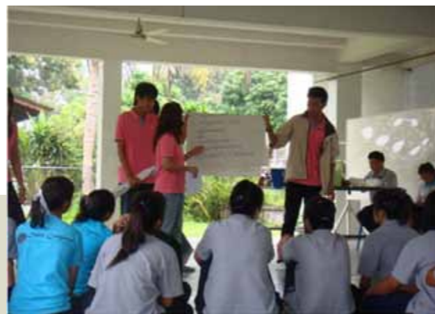
โครงการให้ความช่วยเหลือและเผยแพร่ ความรู้ทางกฎหมายแก่ชุมชน ณ ศูนย์ฝึกและอบรมเด็กและเยาวชนเชียงใหม่ เขต 7