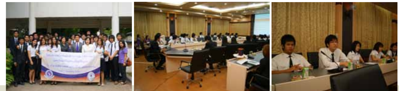
โครงการสโมสรนักศึกษาคณะนิติศาสตร์ มหาวิทยาลัยเชียงใหม่สัณจร ณ คณะนิติศาสตร์ มหาวิทยาลัยนเรศวร จังหวัดพิษณุโลก