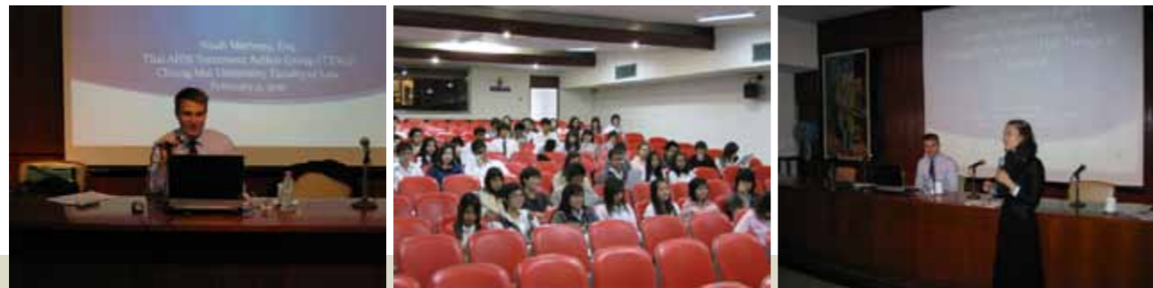
บรรยายพิเศษเรื่อง Intellectual Property Rights and Access to Medicines: The Struggle for HIV/AIDS Drugs in Thailand ในกระบวนวิชากฎหมายทรัพย์สินทางปัญญา (177313)