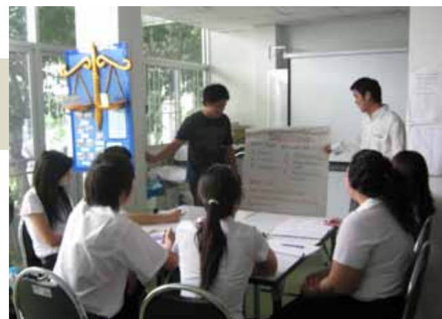
โครงการให้ความรู้กฎหมายแก่นักศึกษาสัตวแพทย์