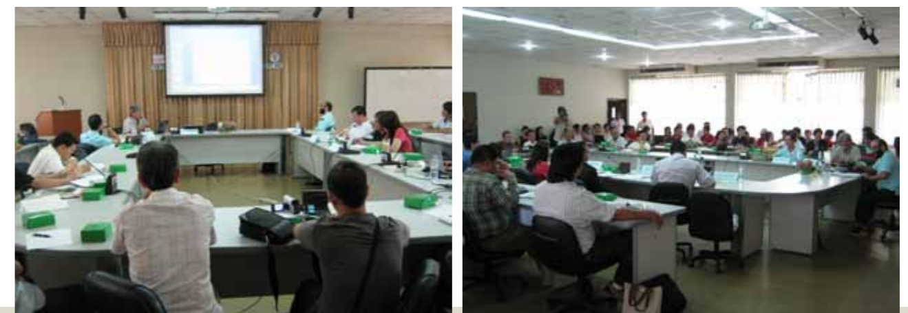
เสวนาวิชาการ 5 ปี รัฐประหารและปฏิรูปการเมืองรอบใหม่