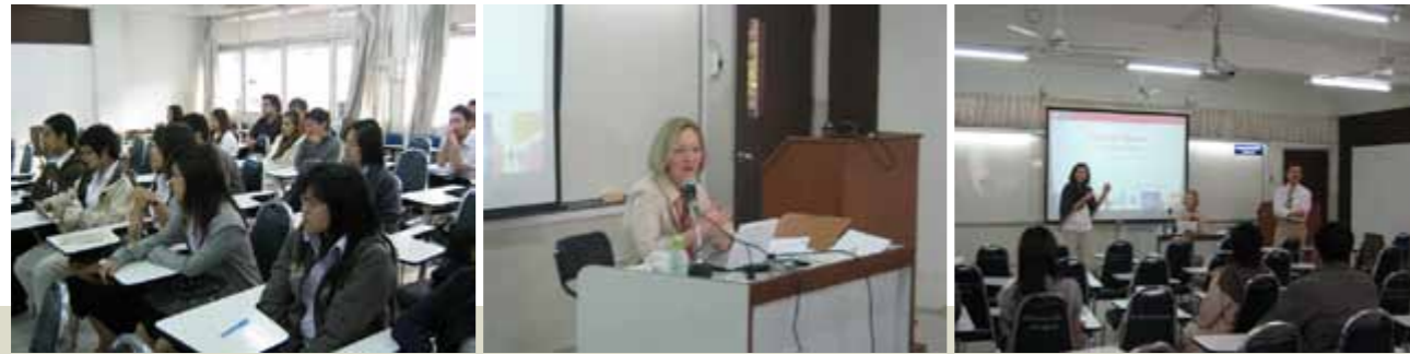
บรรยายพิเศษ เรื่อง The PCT System ในกระบวนวิชากฎหมายทรัพย์สินทางปัญญา (177313)