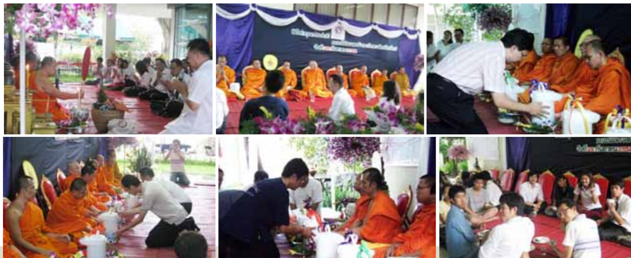
โครงการทำบุญประจำปี คณะนิติศาสตร์