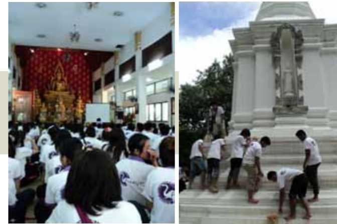
กิจกรรมลูกช้างเชียงใหม่ ปลอดภัยเข้าสู่ศาสนสถาน ประจำปีการศึกษา 2554