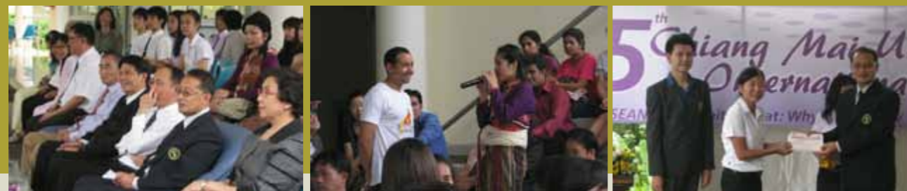
กิจกรรมประกวดบทความ/เรียงความและกิจกรรมถามตอบความรู้เกี่ยวกับอาเซียน ในงาน Chiang Mai University International Day วันที่ 10 สิงหาคม พ.ศ. 2554