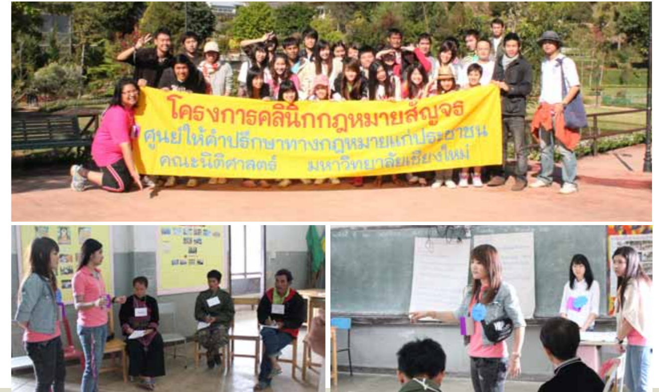
โครงการคลินิกกฎหมายสัญจร ครั้งที่ 1/2554 การสอนกฎหมายในชุมชนและการให้คำปรึกษาทางกฎหมาย