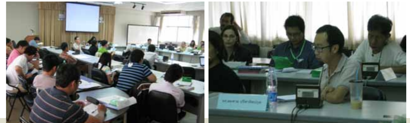
โครงการการจัดเสวนา: “การละเมิดสิทธิมนุษยชนไม่ได้ไกลตัวอย่างที่คิด Universal Periodic Review และสิ่งที่ “คุณ” จะทำได้”