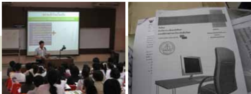
กิจกรรมสัมมนาการตอบข้อสอบกฎหมาย