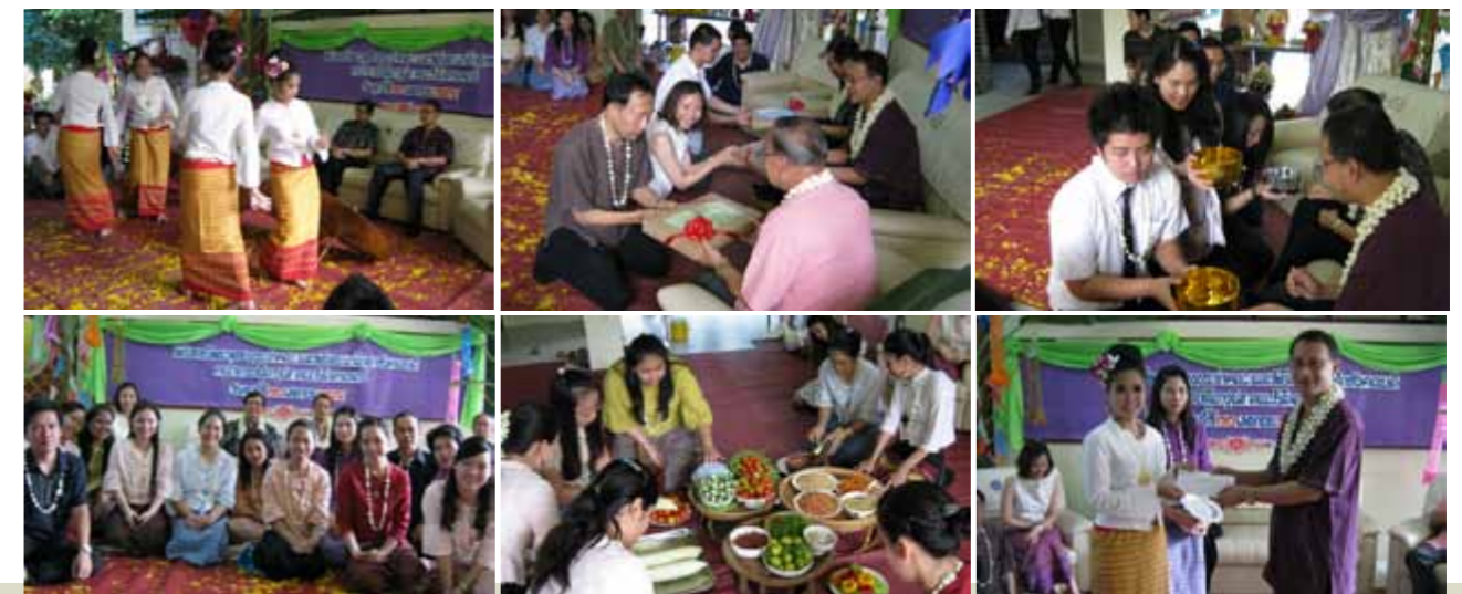
โครงการจัดกิจกรรมดำหัวปีใหม่เมือง