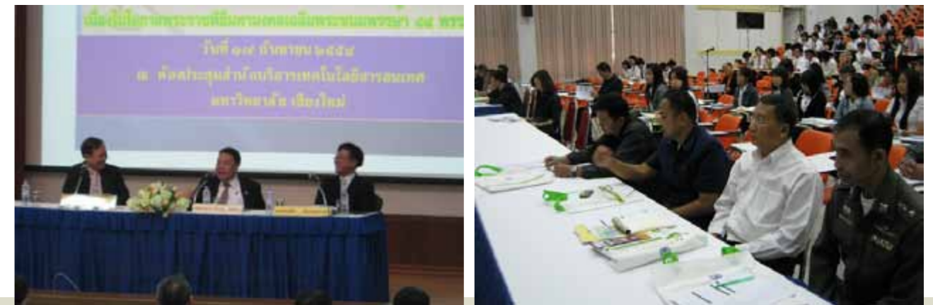
โครงการสัมมนากฎหมายเฉลิมพระเกียรติพระบาทสมเด็จพระเจ้าอยู่หัว เนื่องในโอกาสพระราชพิธีมหามงคลเฉลิมพระชนมพรรษา 84 พรรษา