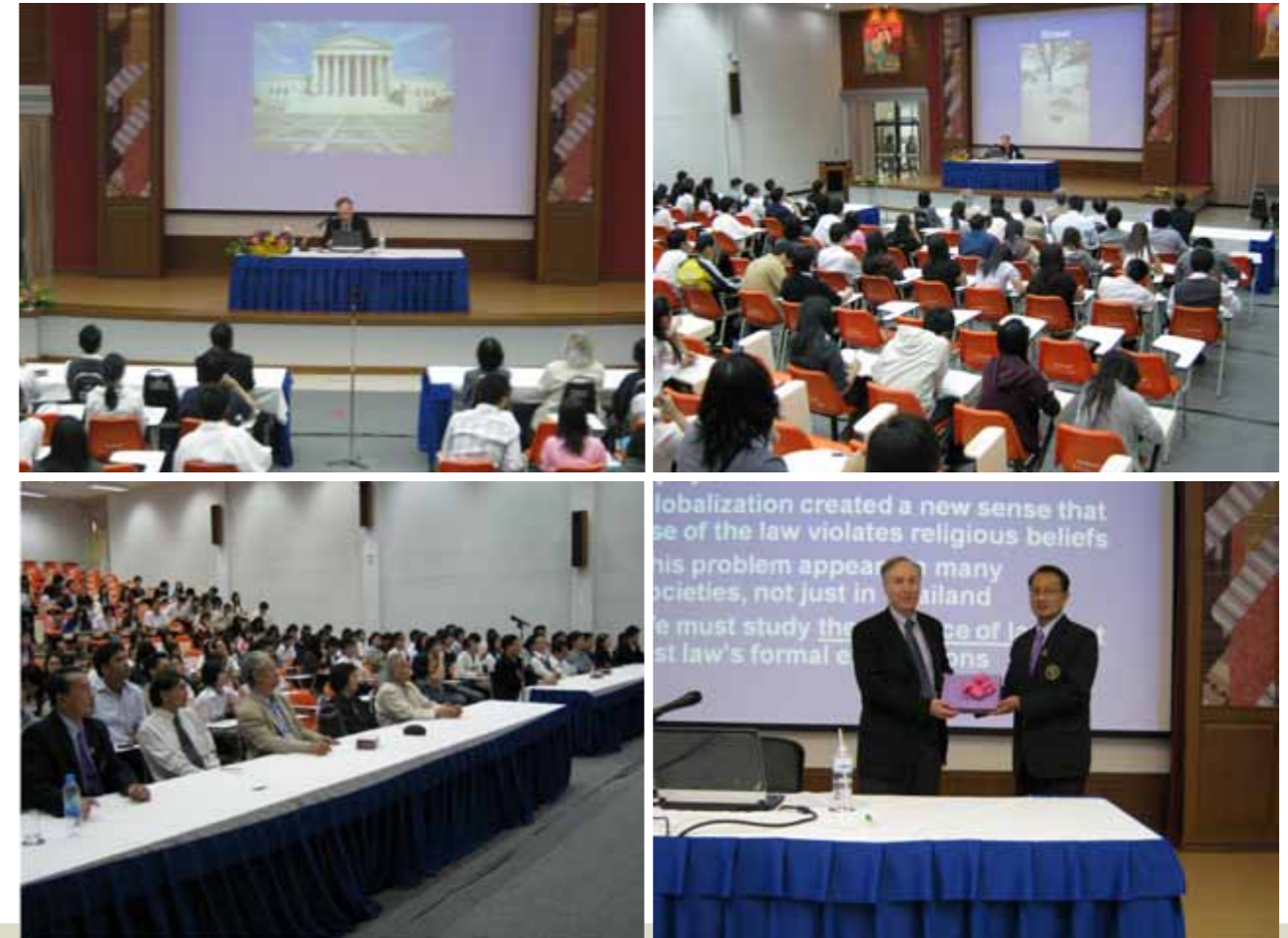
การบรรยายพิเศษ เรื่อง Globalization and Legal Consciousness (โลกาภิวัตน์และนิติสำนึก )