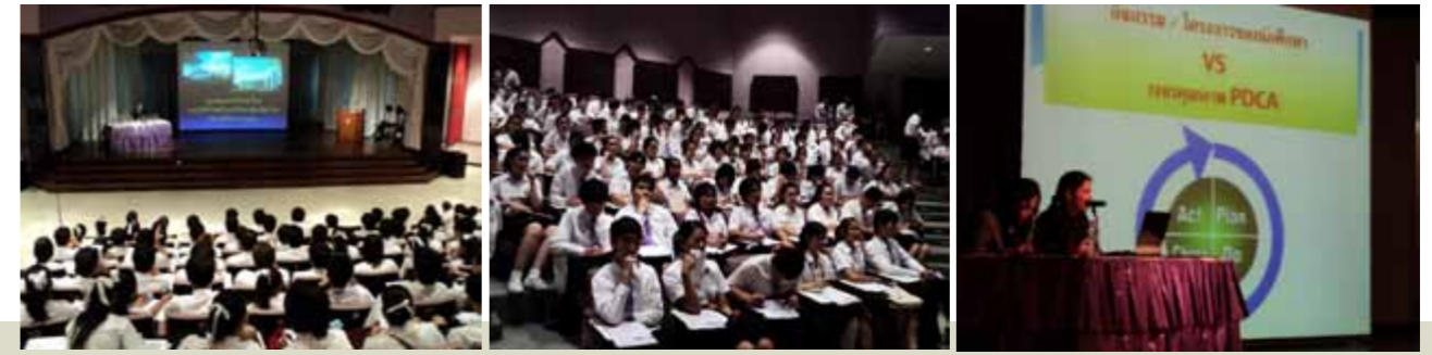
กิจกรรมปฐมนิเทศนักศึกษาใหม่ ประจำปีการศึกษา 2554