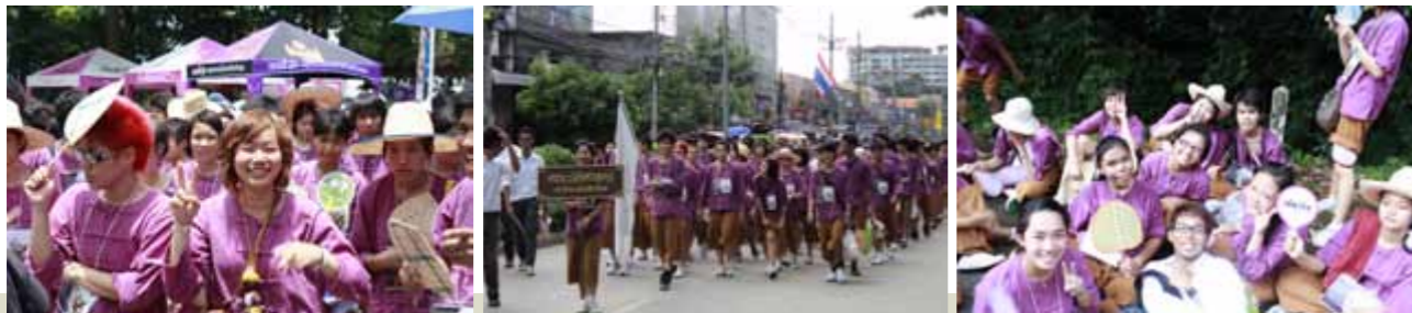
กิจกรรมนำนักศึกษาใหม่นมัสการพระธาตุดอยสุเทพ