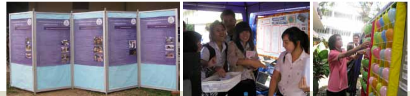
งานวันวิชาการคณะนิติศาสตร์ ครั้งที่ 3