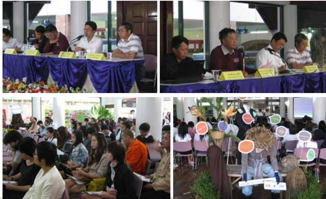
เสวนาวิชาการ เรื่อง ความเปลี่ยนแปลงของสังคมและเศรษฐกิจในชนบทไทย เกษตรกรรมครบวงจร เกษตรกรครบวงจร