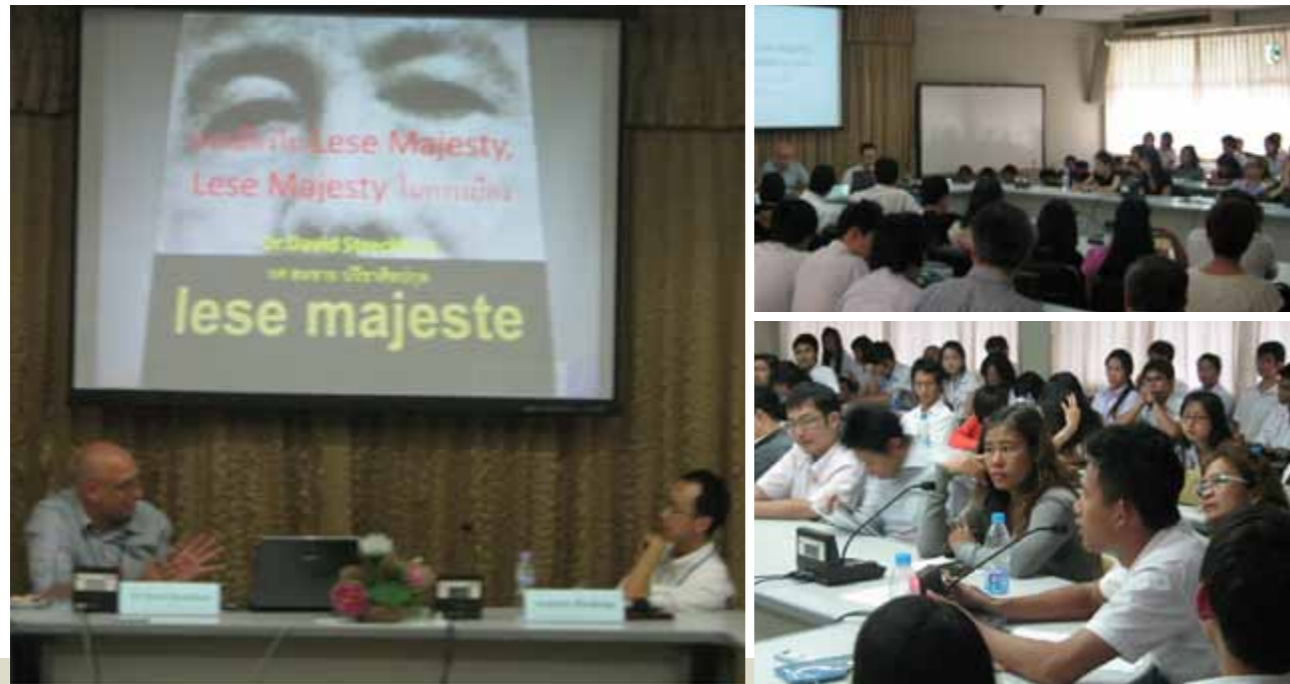
สัมมนา เรื่อง การเมืองใน Lese Majesty, Lese Majesty ในกรณีเมือง