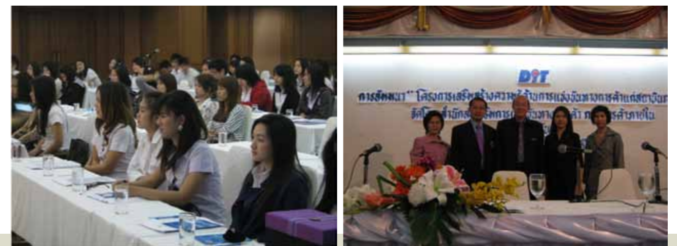
โครงการเสริมสร้างความรู้ด้านการแข่งขันทางการค้าแก่สถาบันการศึกษา