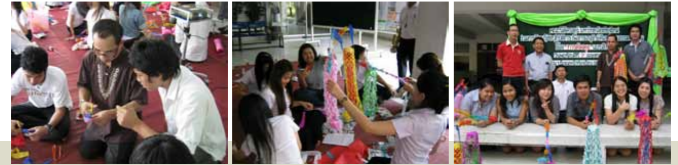
โครงการจัดกิจกรรมเรียนรู้การตัดตุ๊กช่อกระดาศลี แบบล้านนา