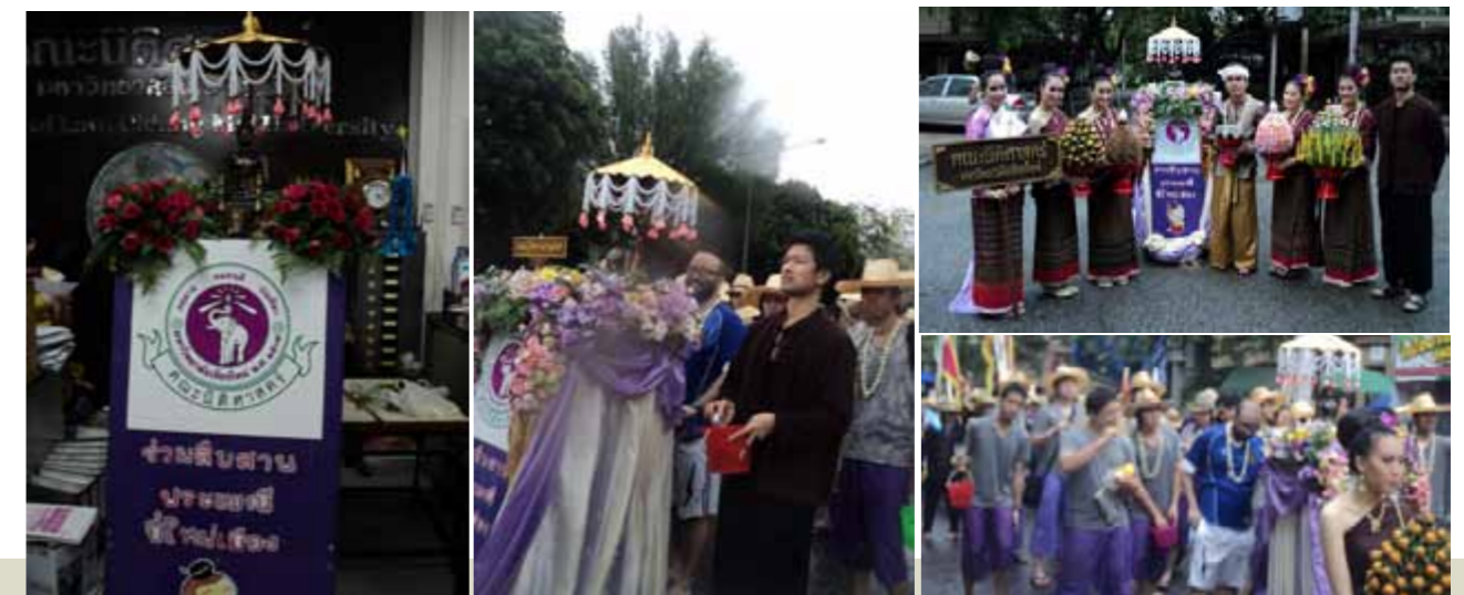
โครงการสืบสานประเพณีปีใหม่เมือง