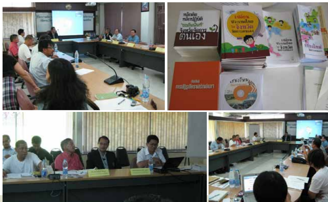
เวทีวิชาการ “แนวความคิดการปฏิรูปโครงสร้างอำนาจรัฐกับการผลักดันบูรณาการเชียงใหม่จัดการตนเอง”